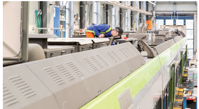
Technisch und optisch up-to-date: Die BLS überholen regelmäßig ihre Flotte