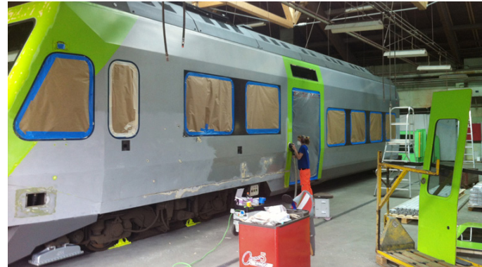
Zügiges „Refit“ der BLS-Züge dank BlueCielo Meridian: Hier die Vorlage für die Lackiererei